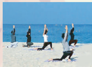
湖畔でのヨーガ Yoga at the lakeside

日本ヴェーダーンタ協会会長 日本ヨーガ療法学会スピリチュアルアドバイザー 1974年インド・ラーマクリシュナ・ミッションの出家僧となり 同僧団のヴィディヤマンディール大学学長を経て、1993年より 日本ヴェーダーンタ協会会長を務める。 著書『スワミー・ヴィヴェーカーナンダと日本』他、誘導瞑想 やマントラのCD等各種。毎月インド大使館にて行われる バガヴァッド・ギーター講話の他、日本全国で講話を行う。その 講話はどれもユニークでわかりやすく、実践的だと定評がある。