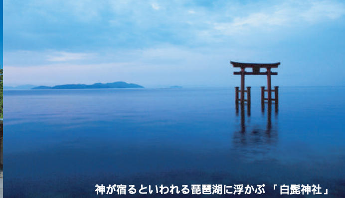
神が宿るといわれる琵琶湖に浮かぶ「白鬚神社」