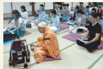
チャンティング&賛歌 Chanting & Songs