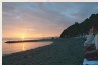
戸外瞑想 Outdoor Meditation