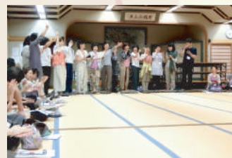
夜のつどい Evening Satsanga